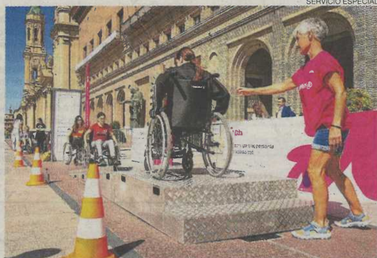
Varias jóvenes participan en la yincana con la ayuda de una voluntaria de Dfa.