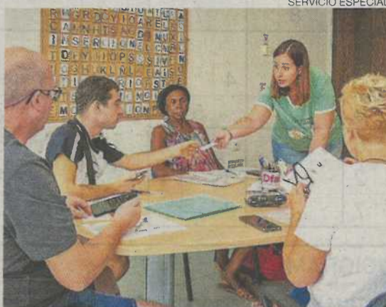
Una de las sesiones realizadas en Fundación Dfa.

Sin inserción laboral, alcanzar la inclusión social es posible que suponga una quimera para cualquier persona. Si además se da el caso de tener una discapacidad, el acceso a un puesto de trabajo puede resultar una barrera difícil de superar. Ante el reto de conseguir que las oportunidades en este ámbito de la vida sean las mismas para todos se enfrenta cada día la Fundación Dfa. Se encargan de ello de manera conjunta el Centro de Apoyo Social y la agencia de colocación Dfaemplea.