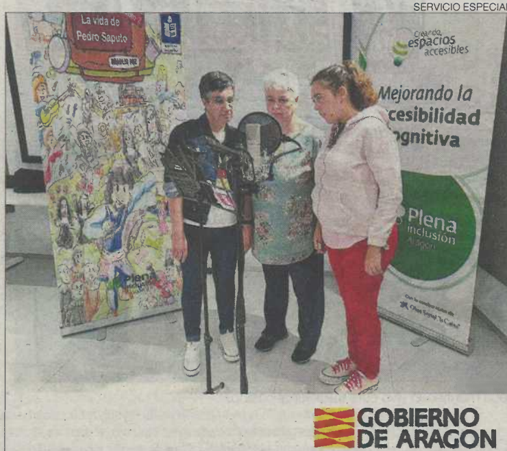
Un momento de la grabación del audiolibro.

Plena inclusión Aragón publicó el año pasado el primer audiolibro de la historia en lectura fácil en lengua española.